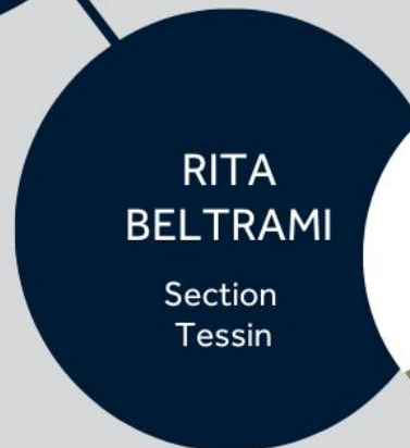
RITA BELTRAMI Section Tessin