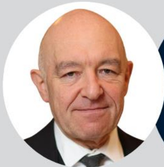
DANIEL JOSITSCH Président Prof. Dr. iur, conseiller aux Etats